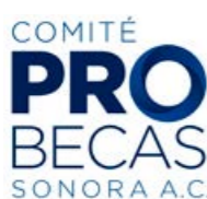
Comité Pro Becas Sonora, A.C.