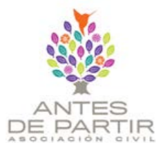
Antes de Partir, A.C.