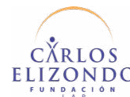
Fundación Carlos Elizondo Macías, I.A.P.