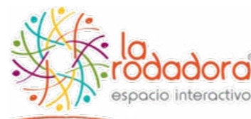
Espacio Interactivo La Rodadora, A.C.